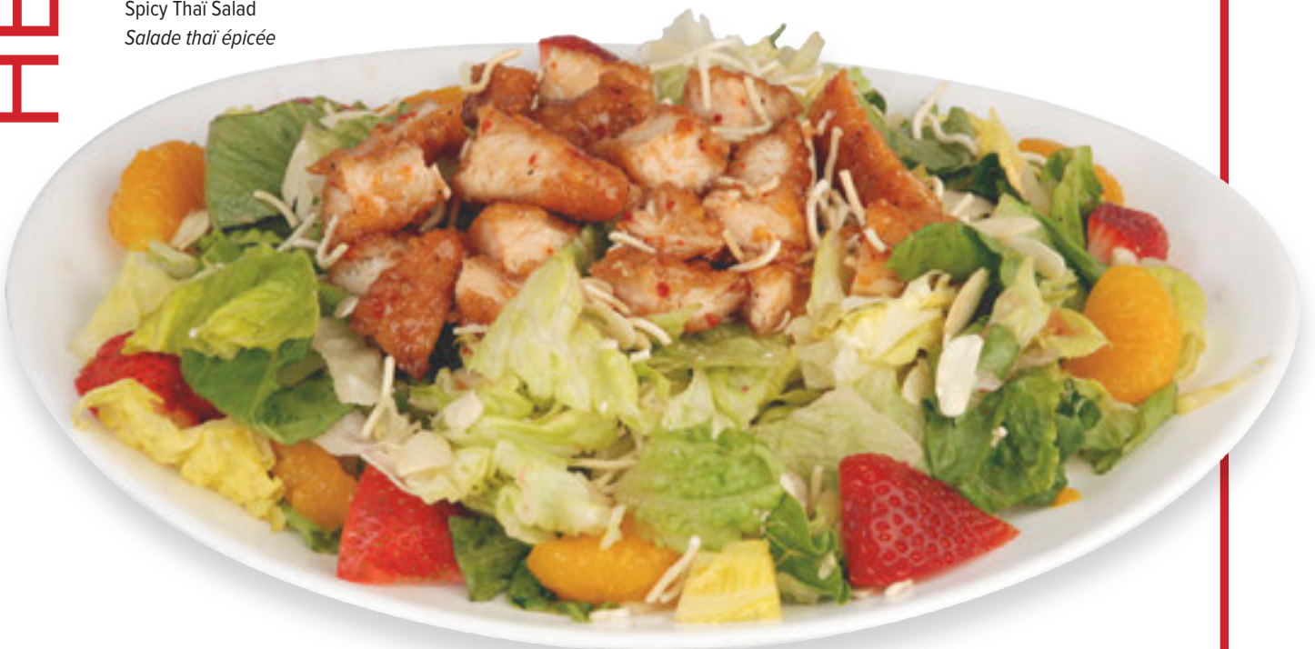
Spicy Thai Salad Salade thaï épicée

Laitue romaine fraîche mélangée avec bacon, mozzarella et croutons, garnie d'une poitrine de poulet grillée à la perfection dans du beurre à l'ail