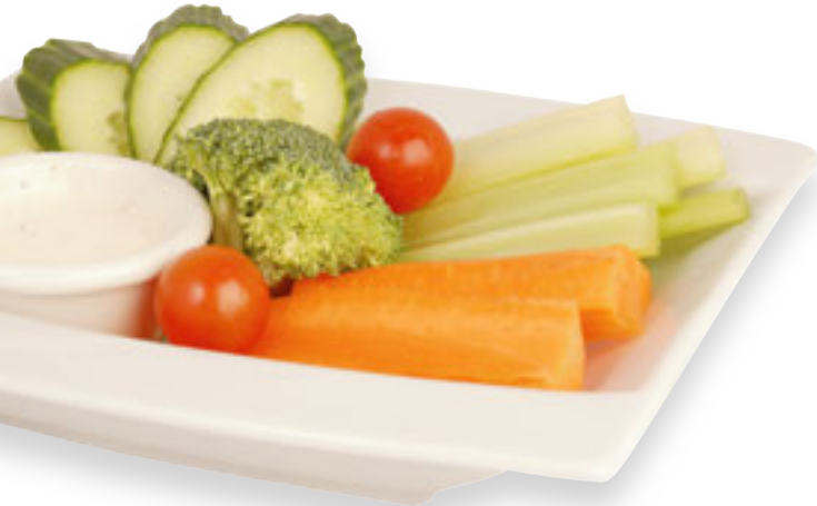
Veggie Tray Plateau de légumes