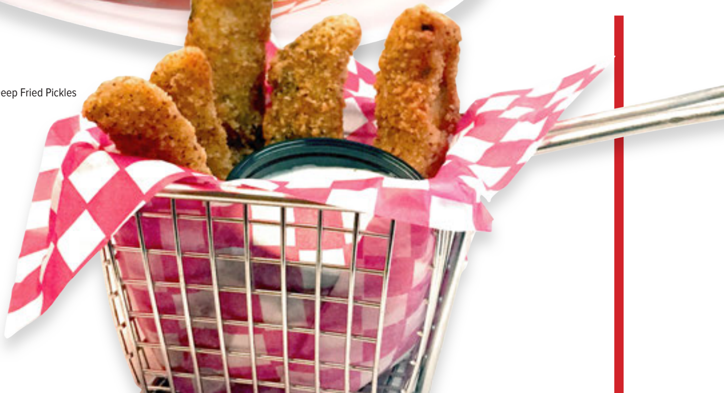
Deep Fried Pickles