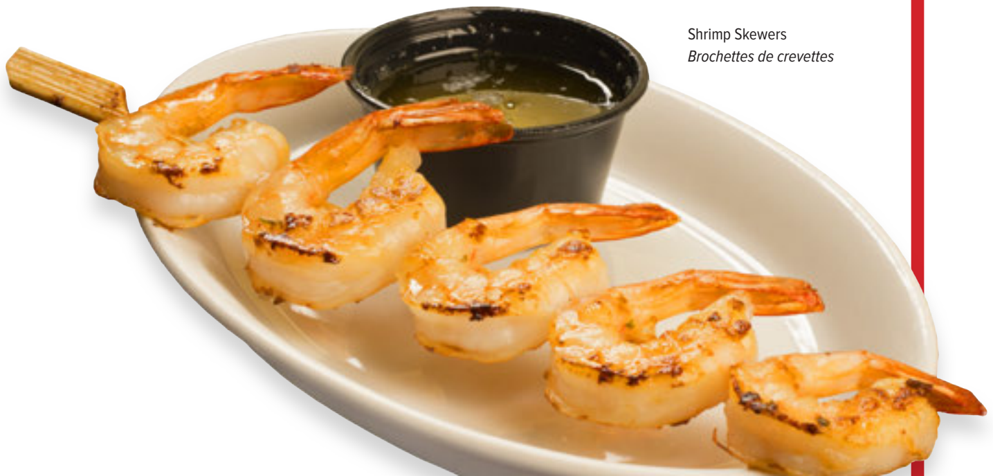
Shrimp Skewers Brochettes de crevettes