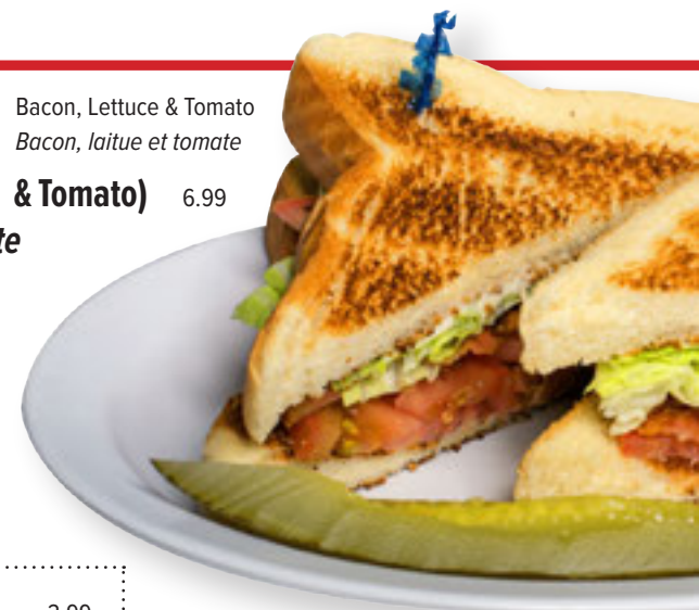
Bacon, Lettuce & Tomato Bacon, laitue et tomate

Add Bacon or Ham 2.99 Ajoutez bacon ou jambon