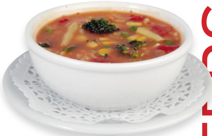
Homemade Soup Soupe maison

Ask your server for the daily soup Demandez à votre serveur pour la soupe du jour