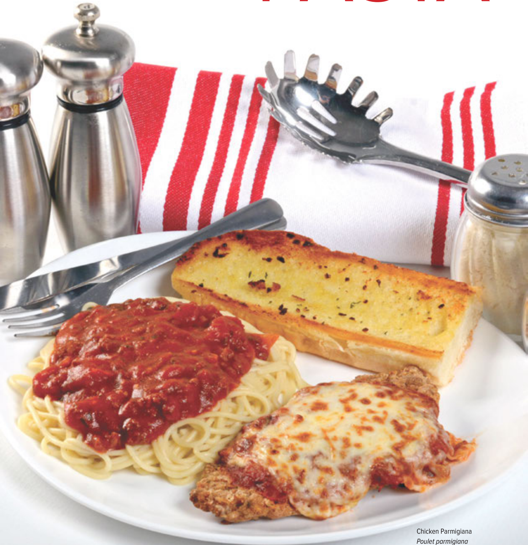
Chicken Parmigiana Poulet parmigiana