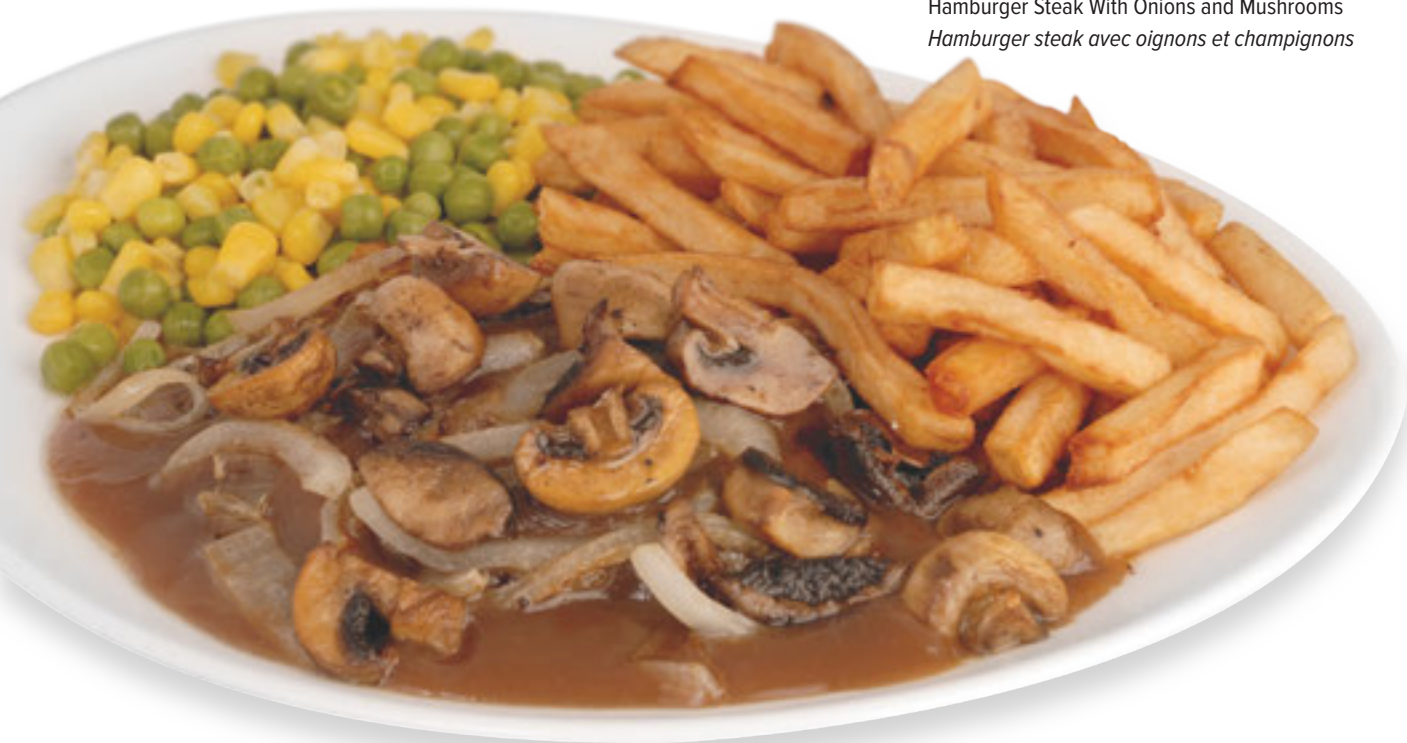
Hamburger Steak With Onions and Mushrooms Hamburger steak avec oignons et champignons