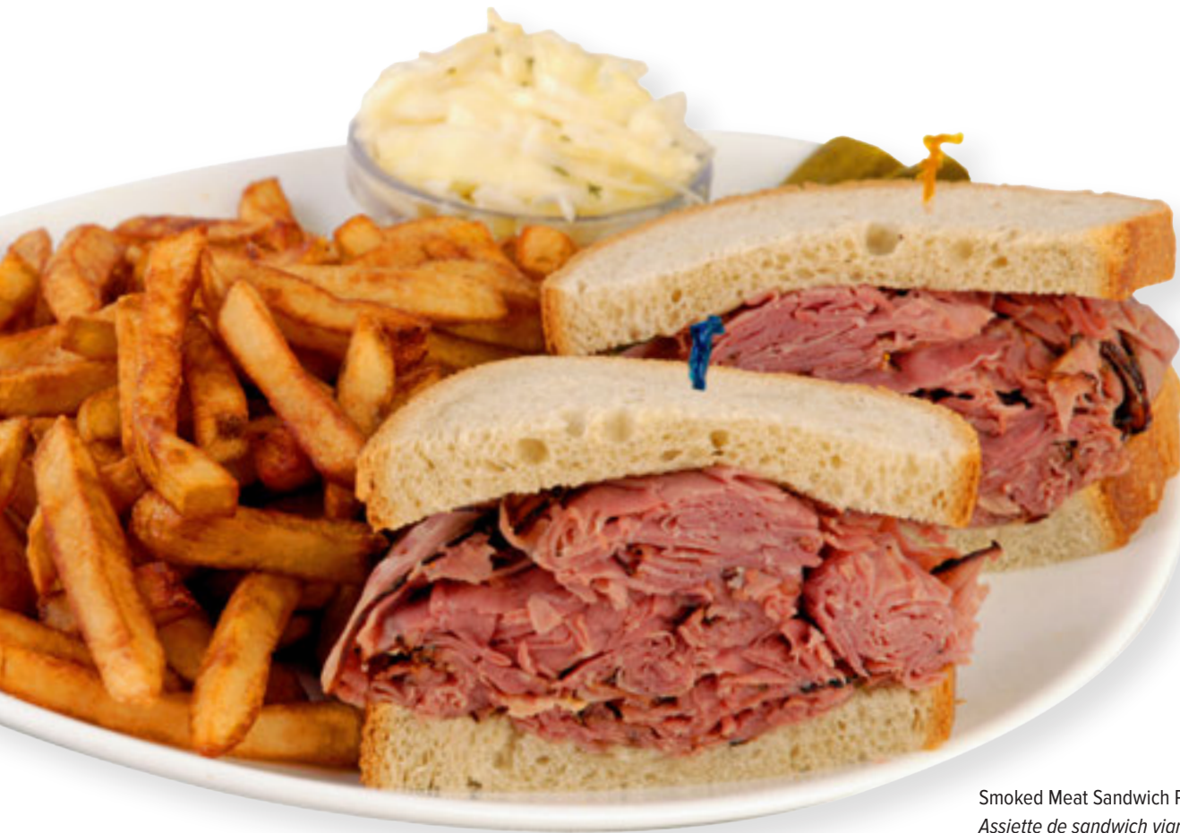
Smoked Meat Sandwich Platter Assiette de sandwich viande fumée