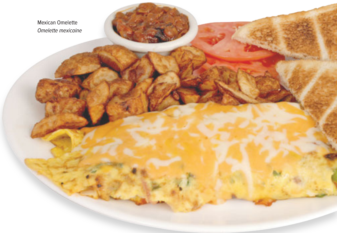
Mexican Omelette Omelette mexicaine

Fait avec trois oeufs, servis avec fèves au lard, pommes de terre rissolées, rôties, confiture et café.