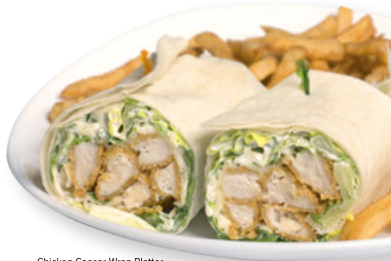
Chicken Caesar Wrap Platter