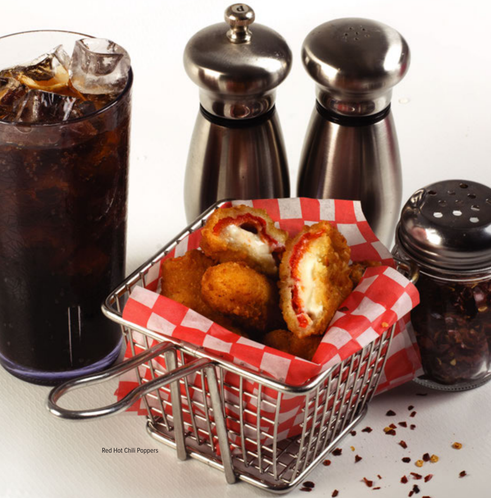
Red Hot Chili Poppers