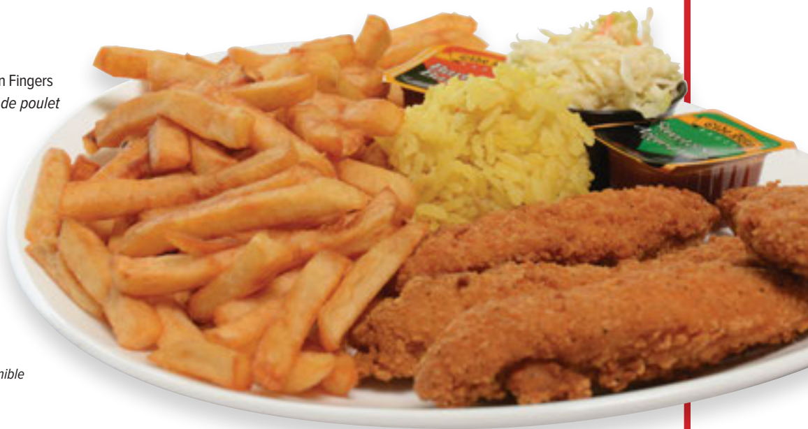
Chicken Fingers Doigts de poulet

Served with fries, rice and coleslaw Servi avec frites, riz et salade de chou