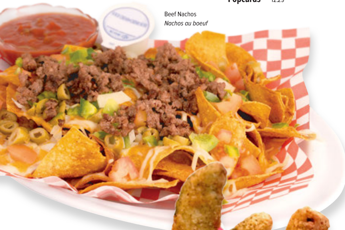
Beef Nachos Nachos au boeuf